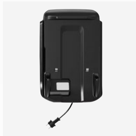
Lade- und Aufbewahrungsstation