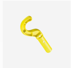
Universalhaken zur Entnahme aus dem Wasser