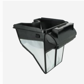
Filterkorb Filtration: 100 µ